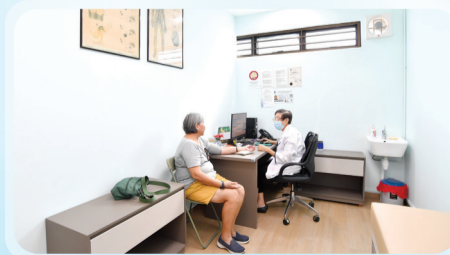
The picture shows the newly renovated, spacious, and bright waiting area and consultation rooms.