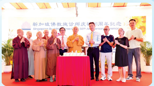
祝贺佛教施诊所56岁诞辰