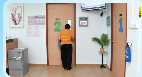
图为焕然一新、宽敞明亮的诊所候诊大厅及诊室。

请折叠粘封，勿用书钉。 Please glue & seal, no staple.