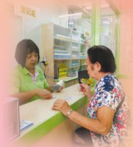
丹戎巴葛分所登记处