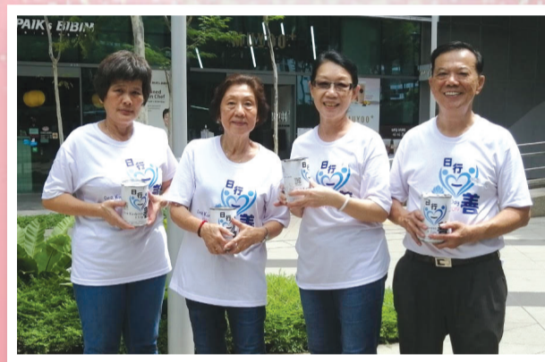
为善不落人后的售旗义工