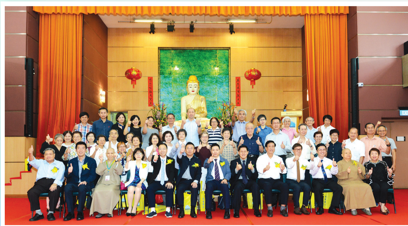
本所董事、全体医师与论坛嘉宾合摄