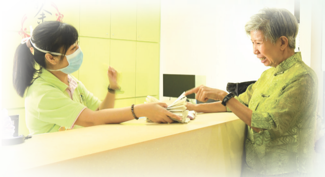
▲ 本所肿瘤治疗中心助理员为作者仔细讲解服药方法

我一向注意饮食运动又无不良嗜好，不料2018年9月被确诊患上第三期乳腺癌且扩散至淋巴节，属于严重激进型。