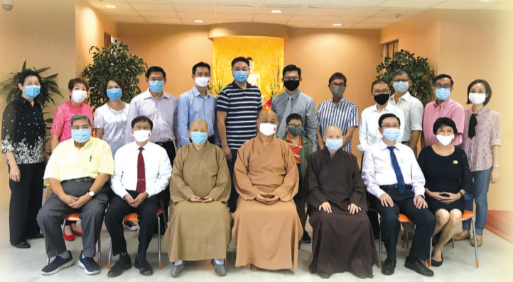
第30届董事就职后与各委员会委员合摄